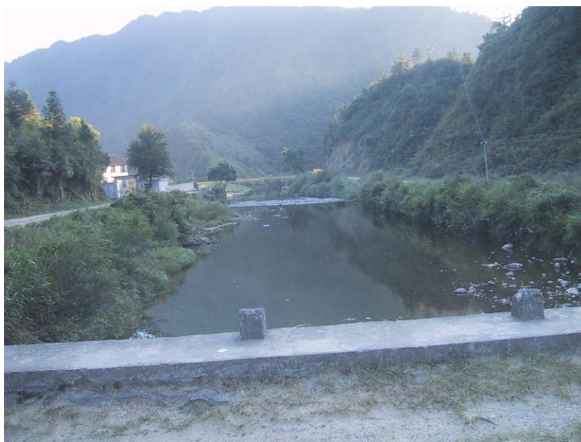
■ 硯山村へ入口の橋