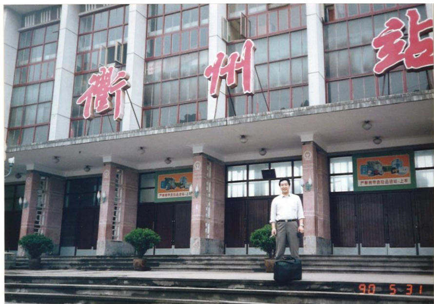
■ 衢州駅 上海より汽車で夜出て朝到着(黄山と景德鎮の中間)