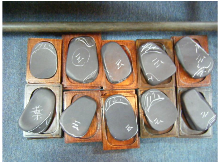
■ 老坑の最終加工のオーダー